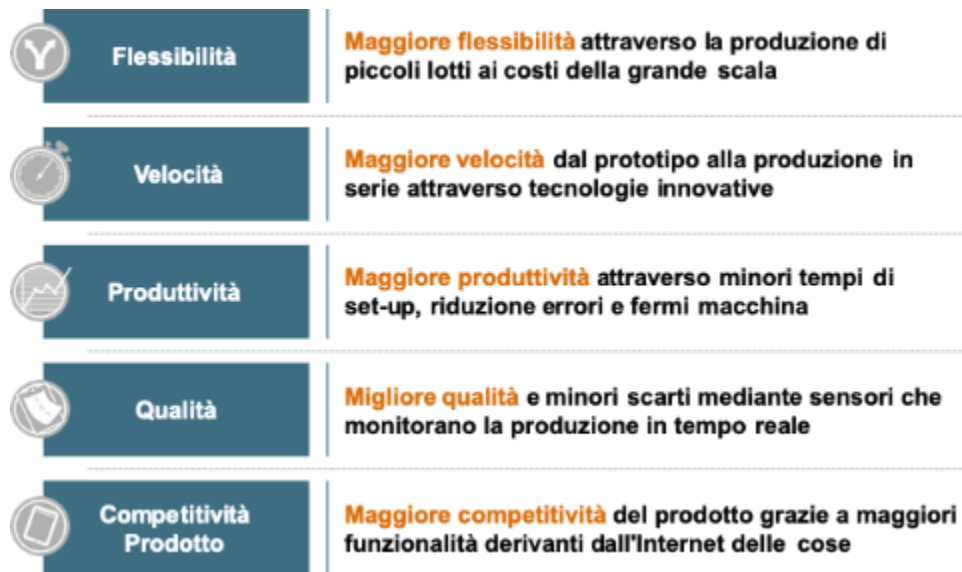
Figura 2: Benefici attesi dall'implementazione di Industria 4.0 in azienda

Dall'utilizzo di queste tecnologie e dei principi guida all'interno del contesto aziendale ci si attendono i seguenti benefici: